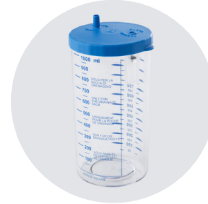
1000cc veya 2000cc KAVANÖZ 1000cc JAR or 2000cc JAR