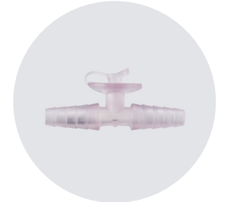
TEK KULLANIMLIK, STERİL MANUEL AKIŞ REGÜLATÖRÜ DISPOSABLE STERILE MANUAL FLOW REGULATOR