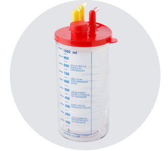
1000cc TEK KULLANIMLIK KAVANÖZ TORBASI DISPOSABLE SUCTION LINER 1000cc