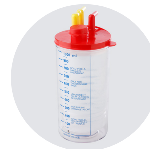
SACCA MONOUSO DA 1000cc DISPOSABLE SUCTION LINER 1000cc