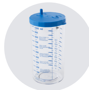
VASO DA 1000cc o VASO da 2000cc 1000cc JAR or 2000cc JAR