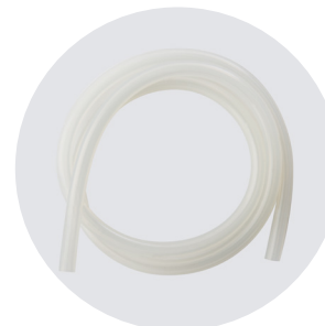
TUBO DI COLLEGAMENTO IN SILICONE DIVERSE MISURE CONNECTING SILICONE TUBE, DIFFERENT MEASURES